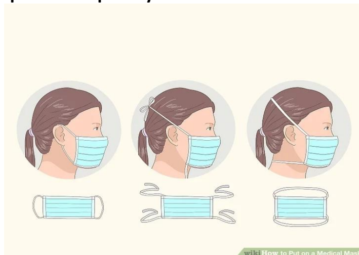
Илустрованом приказу постављања маске

4. Избегавајте контакте са другим особама, користите марамицу кад кијате или кашљете, а исту, након употребе, одложите у канту за отпатке на начин приказан на илустрованим сликама, односно корацима;