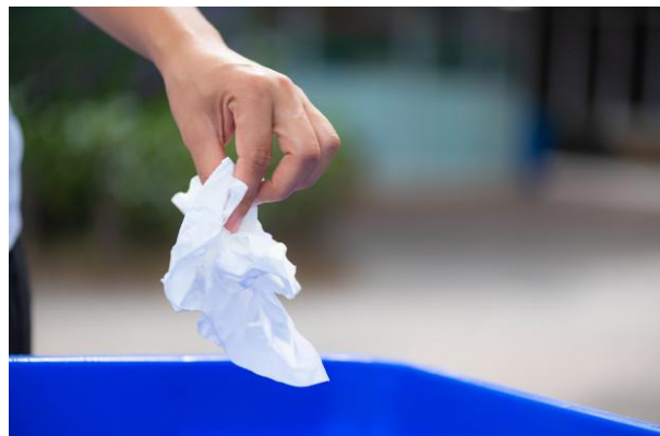
Приказ начина коришћења марамица

5. У случају сумње да сте заражени новим „корона“ вирусом (COVID-19) позовите телефоном епидемиолога института или завод за јавно здравље надлежног за подручје у коме боравите (листа бројева телефона дата у Прилогу 1).